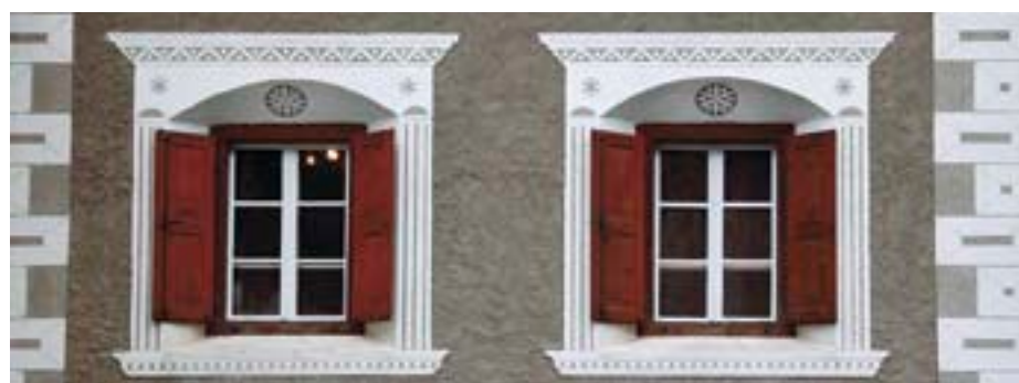
Sull'architrave delle finestre si trova spesso una rosetta (esempio da Bergün).

Chi passeggia per la prima volta attraverso Guarda – un museo all'aperto e località esemplare degli sgraffiti di