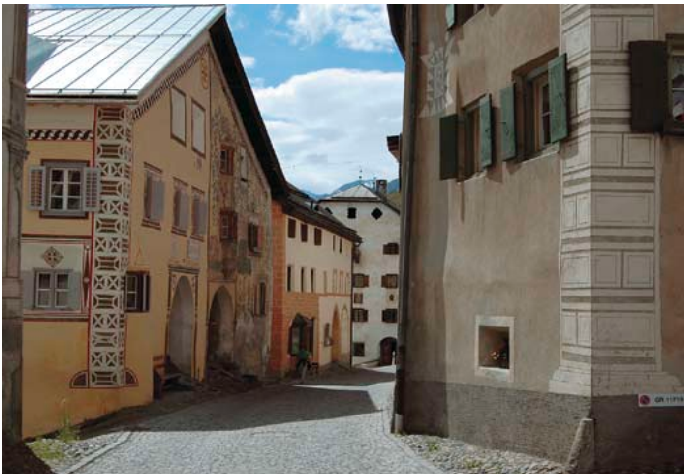
Anche nel villaggio della bassa Engadina gli sgraffiti sono molto frequenti.

detta ruota del sole. Rappresenta il sole, la fertilità e la forza creativa. La fertilità per i contadini svolgeva un ruolo importantissimo, era la premessa per un buon raccolto. Talvolta la rosetta ornava ogni architrave delle finestre. Una tradizione dice, che ogni anno si aggiungeva una rosetta. E a seconda del raccolto, se buono o cattivo, anche la rosetta risultata più o meno bella.