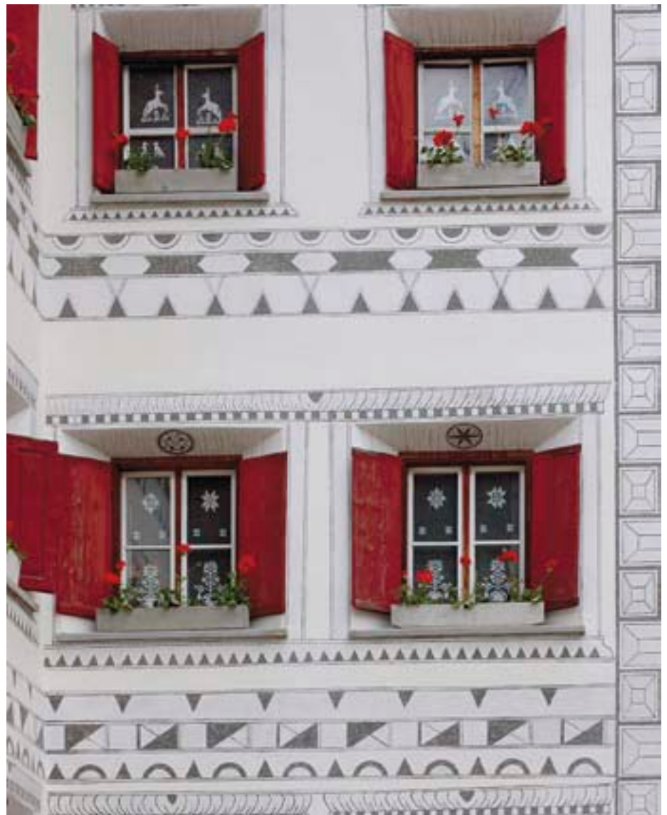
Gli sgraffiti sono tipici per le case dell'Engadina. Ecco un esempio di Susch ai piedi del passo del Flüela.

Lo sgraffito nella casa dell'Engadina proviene originariamente dal sud. Da questa regione provengono pitture variopinte per le case. Nei nostri paraggi queste pitture si sono ridotte agli sgraffiti. Nel 16° secolo è stata portata in Svizzera dai costruttori italiani del Rinascimento e accolta con entusiasmo dagli artigiani creativi.