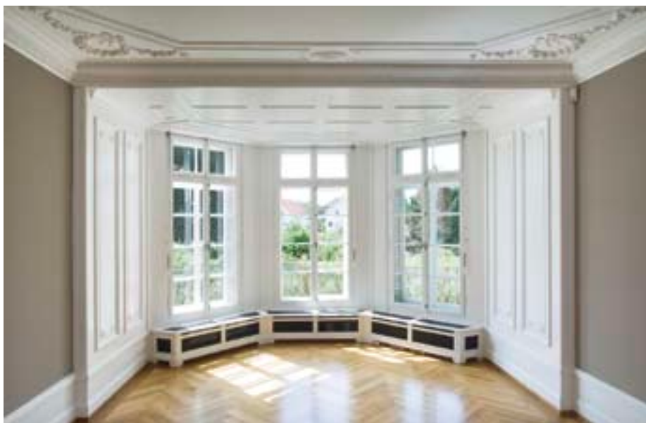
KT 32.009 Porzellanweiss betont die edle Decke des formschönen Raums, und KT 08.006 Ombra 272 Cipro media verleiht den Wänden Tiefe.

Bezugsquelle für kt.Color-Farben: Thymos AG, Lenzburg und Bern