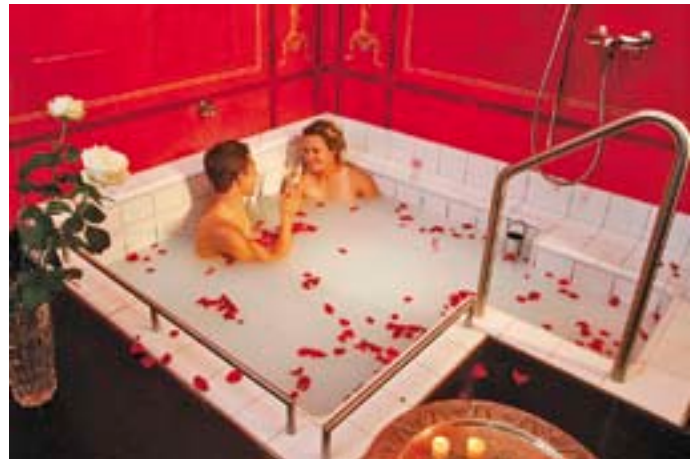
Sich im restaurierten Dorfbad Bad Ragaz fühlen wie im antiken Pompeji.