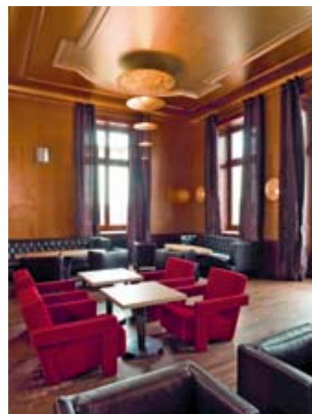
Das Braun der Bar ist mehr als Farbe. Es möbliert den Raum.

Die Malerarbeiten wurden vom SMGV-Mitglied Baumberger Klaus AG, Zürich, ausgeführt.