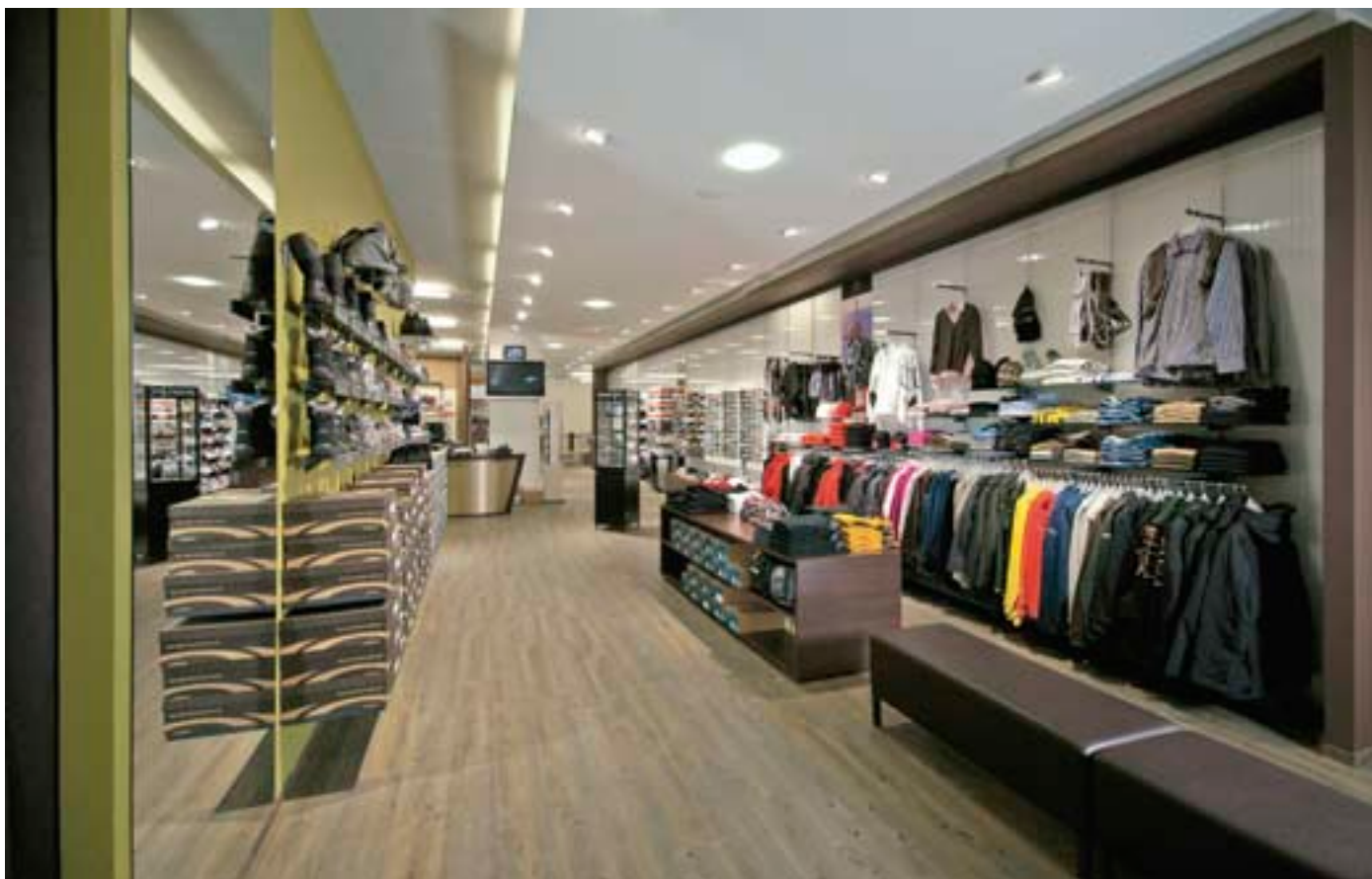
Naturbezogen und dennoch im Trend: Das neue Sportgeschäft im Resort Walensee.