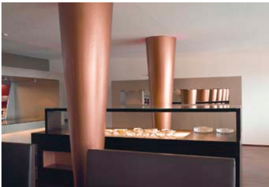
Urbaner Eindruck im Restaurant mit den platinsilbernen Wänden.

Die Bar B21 wirkt edel und warm, während das Restaurant R21 einen urbanen und schnittigen Eindruck macht. Das Sorell Hotel Zürichberg hat bewusst zwei verschiedene Konzepte realisiert und sich erfolgreich positioniert.