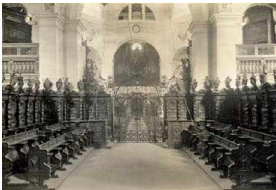
Eine Aufnahme des Chorgestühls von 1925.

Bei näherer Betrachtung der Reliefs konnte festgestellt werden, dass im Laufe dieser Behandlungen der Holzwurmfrass wohl gestoppt worden war, die Oberfläche jedoch durch die verschiedenen Anstriche schokoladebraun