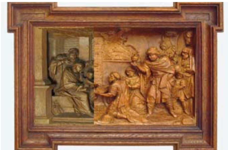
«Anbetung der Könige» von Simon Bachmann (um ca. 1650). Linker Bildteil vor, rechter nach der Abnahme der Übermalungen.

verfärbt wurde. Um die Art dieses Farbüberzugs zu bestimmen, wurden kleinste Probeentnahmen in Harz eingegossen und so dünn geschliffen, dass sie mit Licht durchstrahlt und unter dem