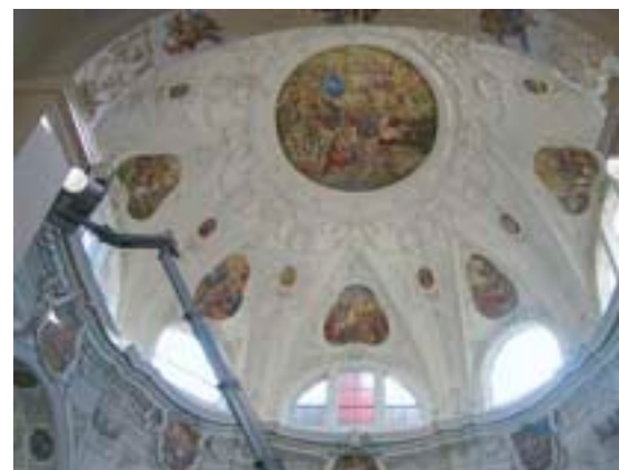
Blick in das Oktogonkuppelgewölbe der Klosterkirche Muri. Von einer Hebebühne aus (links im Bild) wurde der Zustand der Malereien abgeklärt.

dern, wurde durch kleinste Löcher ein feiner Mörtel eingeführt und so wieder eine Verbindung zum Untergrund geschaffen. Am zentralen Kuppelbild, der Ecclesia, war ein Bereich so stark vom Untergrund abgewölbt, dass ein solches Hinterfüllen nicht möglich war. So musste auf eine Massnahme zurückgegriffen werden, welche vom Prinzip her schon 1929 grossflächig angewandt wurde: An wenigen Punkten wurden rostfreie Schrauben durch die Putzschichten in die darunterliegenden Schalungsbretter eingedreht, so dass durch die Auflagefläche einer Unterlagscheibe die Malerei gestützt wird (Abbildung unten). →