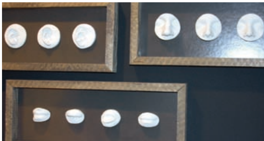
«Chopfsalat», gerüstet von Rudolf Kopp aus Wiedlisbach, landete im Wettbewerb «Gips goes crazy» auf Rang 3.