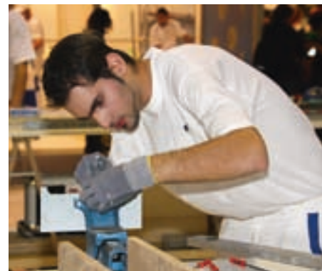
Die Gipser mussten ein Portal in Leichtbauweise konstruieren. Perfekt geglättete Putzoberflächen und Stuckaturen gehörten mit zur Aufgabe.