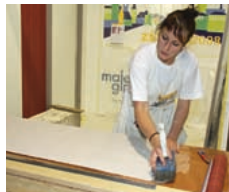
Tapezieren im Eilzugtempo. Dieser Wettbewerb wurde als sogenannter Speed-Wettbewerb, also unter Zeitdruck, durchgeführt.