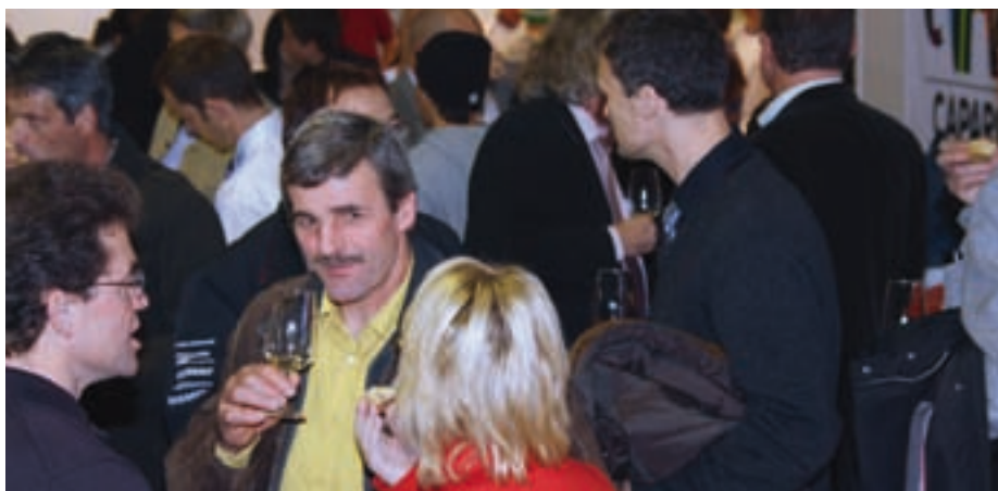
Der SMGV dankte den Sponsoren und Lehrmeistern für Ihre Unterstützung in Form eines Apéros am Freitag Nachmittag, dem 28. November 2008, kurz vor Ende der Wettbewerbe.