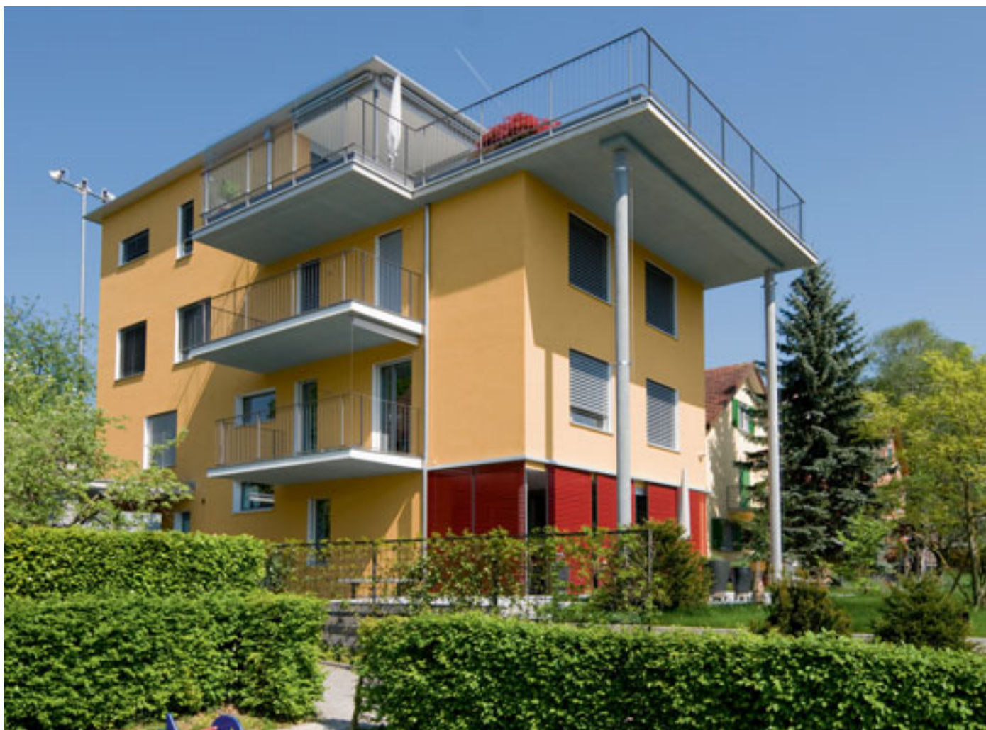
Eine biozidfreie, verputzte Aussenwärmedämmung bedeutet nachhaltige Fassadengestaltung – ob bei einer Sanierung oder bei diesem Neubau mit 200 mm EPS-Dämmung.

Vielen historischen Putzen macht Feuchtigkeit wenig aus. Sie sind dick genug, um Mauerwerk und Oberfläche trocken zu halten. Sie speichern selbst das Wasser eines dreitägigen Schlagregens und geben es bei trockenem Wetter wieder ab. Im Zuge der Rationalisierung am Bau wurden Putze seit gut fünfzig Jahren immer dünner ausgeführt, sodass