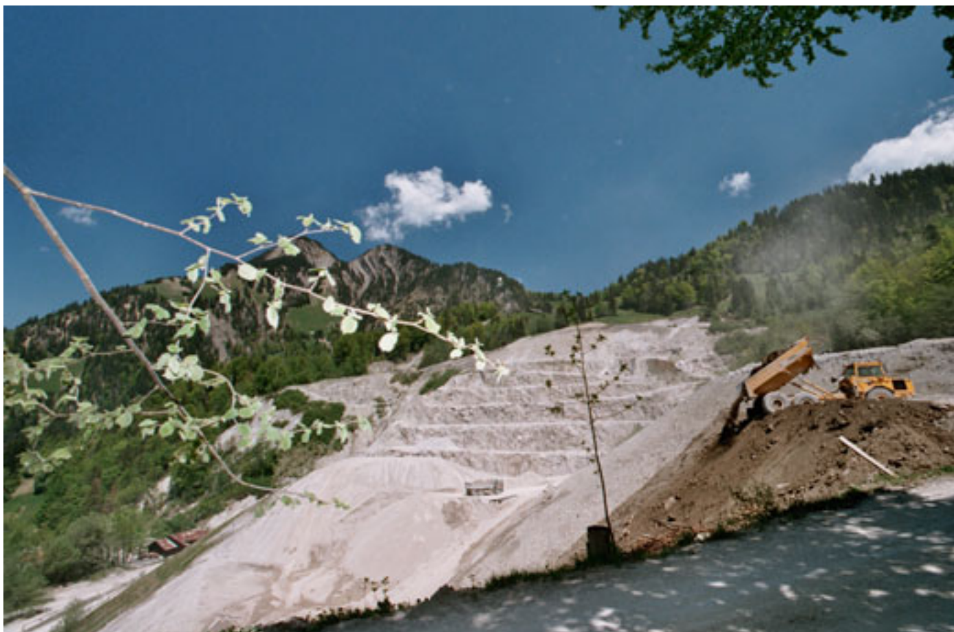
Im Steinbruch Melbach in Ennetmoos NW baut die Fixit AG jährlich 80'000 Tonnen Gipsrohstein ab. Dieser bildet das Ausgangsmaterial für den in der Schweiz sehr beliebten Weissputz.