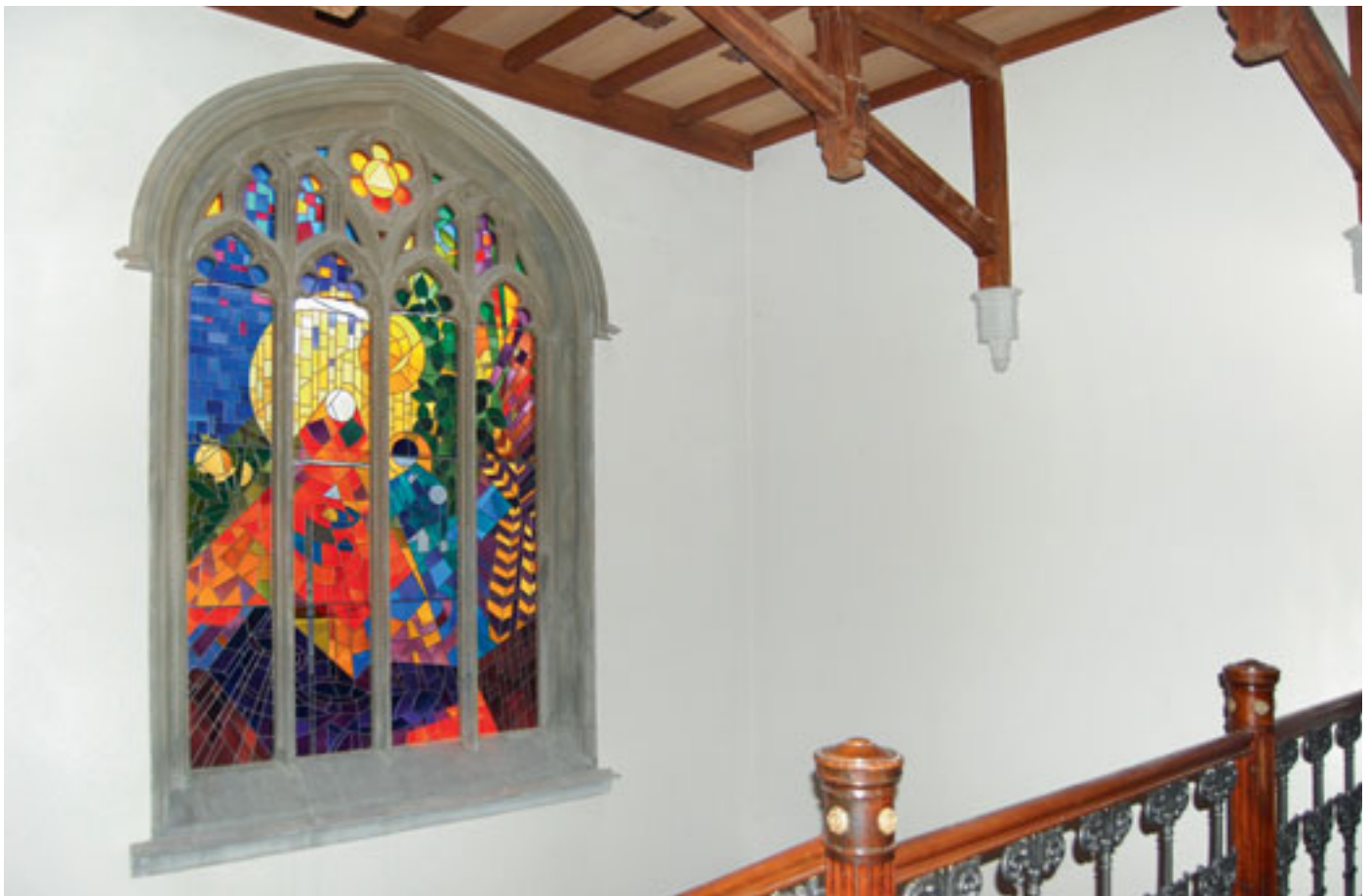
Der Treppenaufgang in der Halle wird von einer grossen Glasmalerei dominiert.

gestrichen, die von den Tapeten befreiten dreimal. Die alten und neuen Weissputzwände in den Badezimmern erhielten – im Ausgleich zu den unterschiedlich saugenden Untergründen – einen Voranstrich mit einer auf die Schlussbeschichtung abgestimmten, gut deckenden, haftvermittelnden Grundierfarbe. Die Schlussbeschichtung war ein zweimaliger Anstrich mit einer seidenglänzenden, PU-verstärkten und daher hoch strapazierfähigen Dispersion. Damit haben die Wandflächen einen neuen Glanz erhalten. Sie sind zusätzlich sehr robust gegen Flecken und Vergilbungen. →