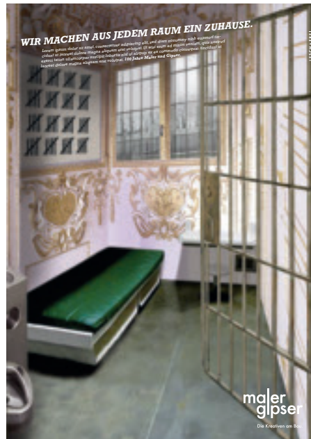
Die Inserate der Dachkampagne sind frech und frisch.