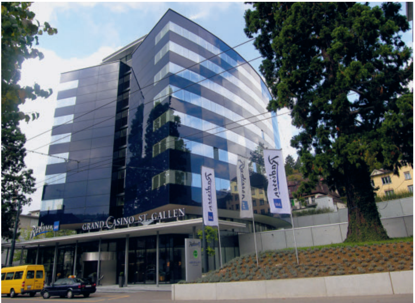
Das Hotel Radisson bot den Rahmen für die Delegiertenversammlung.

gangsworte passten sehr gut zum dominierenden Thema am ersten Tag, die Dachkampagne des SMGV. Es sei, so Kradolfer, Handlungsbedarf angesagt, wolle man als Verband nicht in die zweite Liga der Branchenverbände abstei-