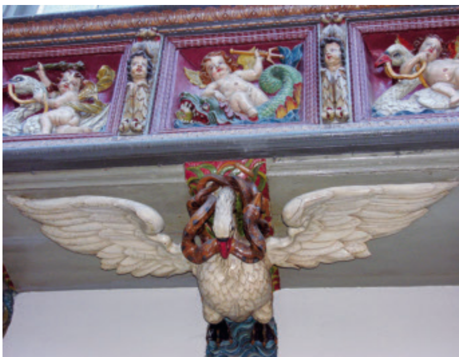
Beliebtes Motiv: der Schwan, der den Erker trägt.

gen. Die Schlüsselbegriffe, die er nannte, waren Ausbildung, Weiterbildung, Wirtschaftswindender Marktanteil der Gipser, Berufsstand der Trockenbauer und das Marketing. Zweifelsohne lauten die Reizworte auf Seite der Maler ähnlich. Mit dem Zitat des französischen Autors Antoine de Saint-Exupéry «Die Zukunft soll man nicht voraussehen wollen, sondern möglich machen» stimmte er schon mal tüchtig auf die etwas später folgende Diskussion zur Dachkampagne ein.