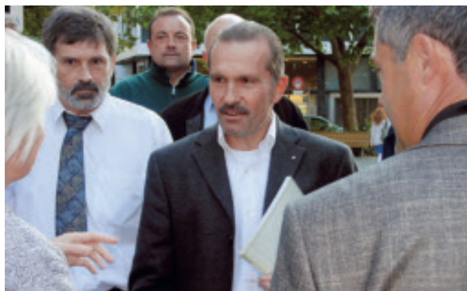
Mit Interesse am Rundgang dabei.

«Wir machen aus jedem Raum ein Zuhause» (siehe Sujets auf Seite 32).