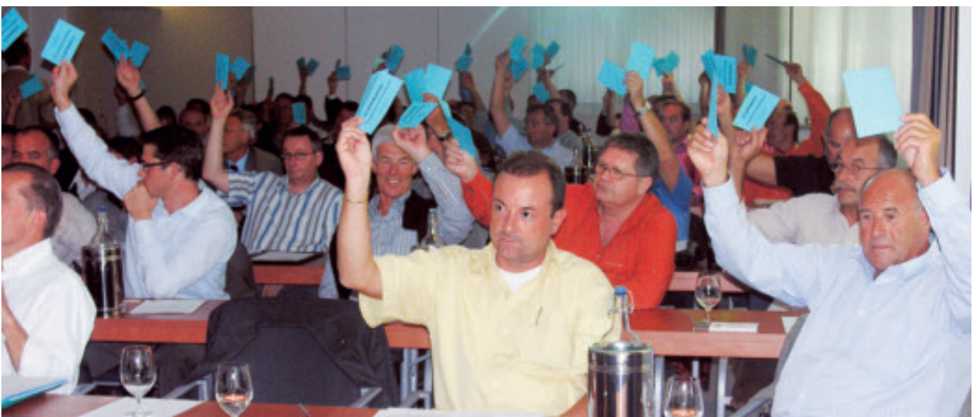
Kaufmanns Wahl in den Zentralvorstand war bei den Delegierten unbestritten.