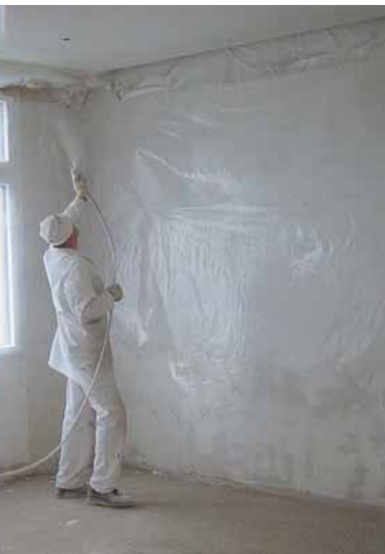
Ein Arbeitsgang reicht in der Regel nicht: Aufgespritzte Beschichtungen sind häufig ungleichmässig.

fläche des Beschichtungsfilms. Die meisten Beschichtungen sind nämlich nicht vollständig matt – sie verfügen, vor allem im Streiflicht, über einen schwachen Seidenglanz. Dieser hängt von der Mikro-Rauigkeit der Beschichtungs Oberfläche ab. Schon geringe Unterschiede in dieser Feinstruktur wirken sich auf die Reflexionseigenschaften der Beschichtungs Oberfläche aus. Im Streiflicht können so Unregelmässigkeiten erscheinen.