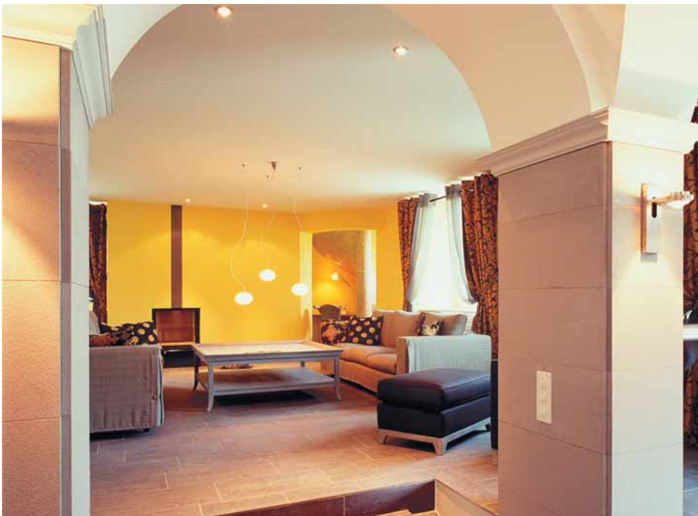
Das Zusammenspiel zwischen Putzoberfläche und Beschichtung ist diffizil. Die Beachtung der materialspezifischen Eigenschaften wird durch Resultate belohnt, die lange Freude machen.