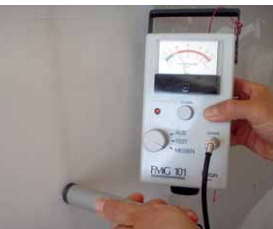
Das Prüfgerät bringt ans Licht: Gips bindet gerne Wasser.

Bezeichnend ist, dass praktisch nie Probleme auftreten, wenn die Maler- und Gipserarbeiten aus einer Hand kommen. Ein Verarbeiter, der beide Arbeitsgänge ausführt, weiss, worauf er zu achten hat. Diesbezüglich sind hier auch die Bauherrschaft bzw. der Planer gefragt, die mit ihrer Suche nach dem günstigsten Angebot das Risiko von Fehlleistungen erhöhen. ■