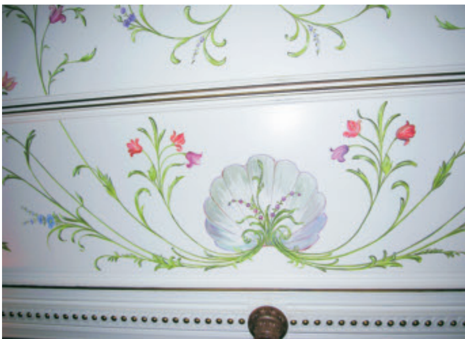
Im Salon erster Klasse des Raddampfers «Uri» zieren Dekorationsmalereien mit Blumenmotiven die Decke.

der Schweiz. Er wurde 1901 von den Gebrüdern Sulzer, Winterthur, erbaut und 1991–1994 umfassend renoviert. Speziell zu erwähnen ist der ursprünglich von Filippo Cassina aus Mailand geschaffene neobarocke Salon erster Klasse mit reichem Schnitzwerk aus Nussbaumholz und Deckenmalereien mit Blumenmotiven. Krönung der gut vierstündigen Schifffahrt war ein umfangreiches Feuerwerk, das auf einem Feuerschiff abgebrannt wurde. ■