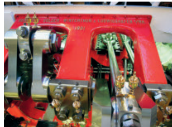
Ölglänzend präsentiert sich die Sulzer-Dampfmaschine mit Baujahr 1901.