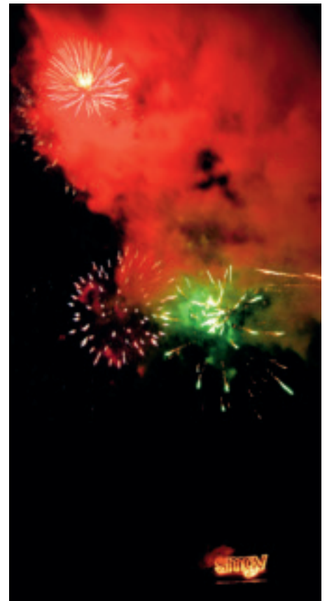
Die Überraschung des Abends: ein Feuerwerk eigens für die SMGV-Jahresdelegiertenversammlung.

Der festliche Abend fand auf dem Dampfschiff «Uri» statt. Dabei handelt es sich um den ältesten Raddampfer