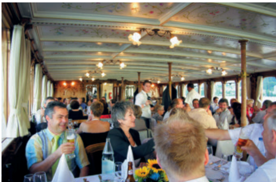
Im neubarocken Salon des Raddampfers tafelt es sich gediegen.