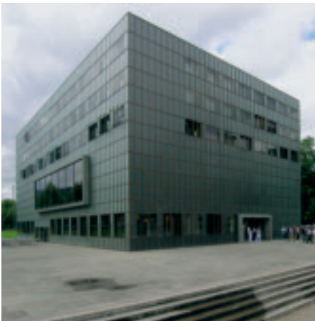
Die 99. Jahresdelegiertenversammlung des SMGV fand im Armee-Ausbildungszentrum Luzern statt.

Die erste Delegiertenversammlung des interimistischen Zentralpräsidenten des Schweizerischen Maler- und Gipserunternehmer-Verbandes SMGV, Louis Werren, verlief ruhig und in geordneten Bahnen. Nur bei einem Antrag zum Normpositionen-Katalog NPK entschieden sich die Delegierten gegen die Empfehlung des Zentralvorstandes. Da es sich um eine Jahresdelegiertenversammlung handelte, gab es einen festlichen Abendanlass, und zwar auf dem Dampfschiff «Uri».