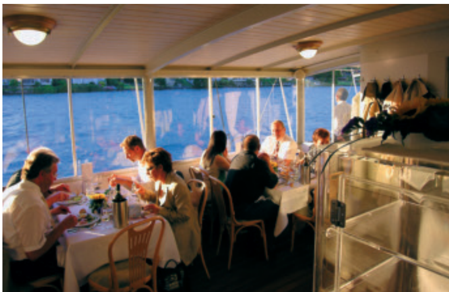
Die letzten Strahlen der Abendsonne kontrastieren mit dem bereits im Dunkeln liegenden Ufer.