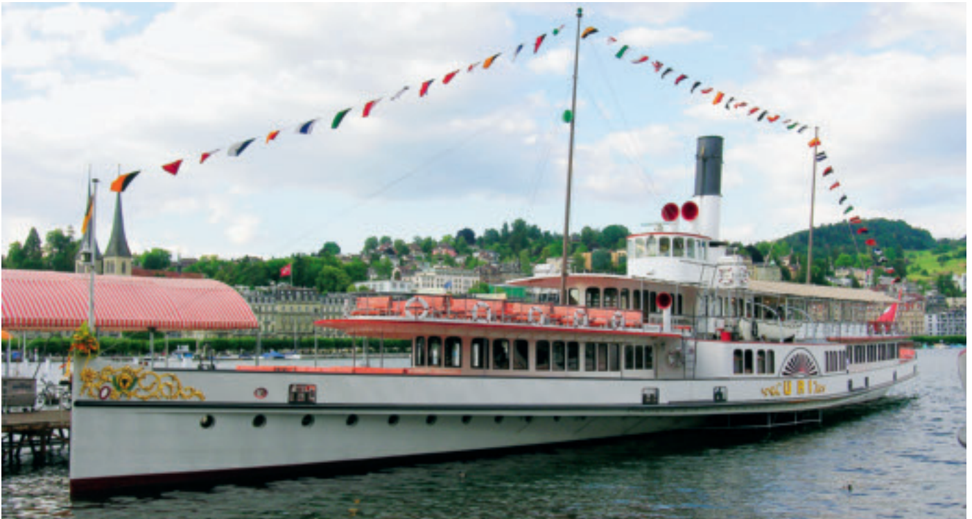
Festlich beflaggt, wartet der Raddampfer «Uri» auf die über zweihundert Gäste am Abendanlass der Jahres-DV.

vor (das hatte bereits die applica in ihrer Ausgabe 12/2007 getan), sondern wählte «nicht ganz hundert» als Motto seiner Begrüßungsansprache, handelte es sich doch um die 99. Jahresdelegiertenversammlung des SMGV.