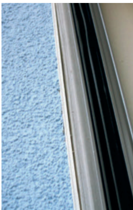
Werden Gewebeleisten ohne Teleskop-Eigenschaft eingesetzt, können sich bei grossen Längen die Profile wie hier ablösen.