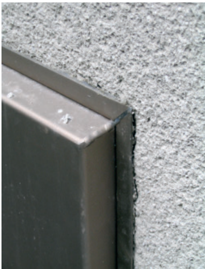
Bei diesem vorstehenden Fenster ist die Konstruktion mit Metallprofilen und Dichtstoff misslungen: Die WDVS-Deckschicht ist gebrochen.