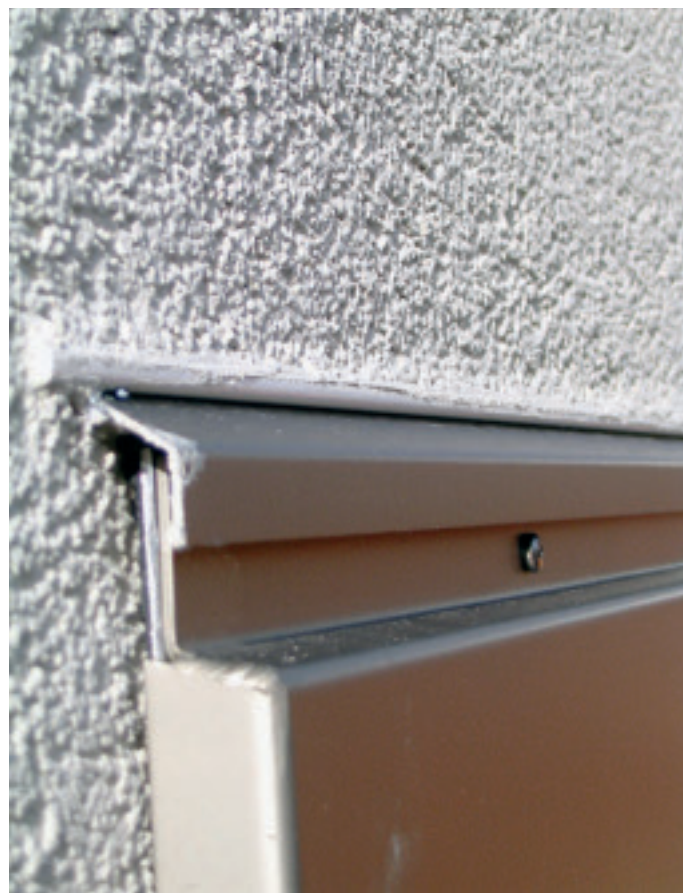
Erfolgreiche Sanierung der Fensterkonstruktion mit Hilfe eines Überstülpkastens und durch Anwendung eines Blechanschlussprofils aus Kunststoff (im Bild oben, eingeputzt).

Detail, aber ein ganz wesentliches, das bei der Anwendung von Anschluss-, Dicht- und Schutzprofilen aus Kunststoff – vor allem bei fassadenbündig eingebauten Bauteilen – als (noch) nicht ausreichend gelöst eingestuft werden muss: die Eckstösse.