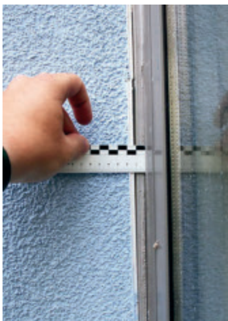
Gewebeleisten ohne Teleskop-Eigenschaft: Profilablösung im Stumpfstoss.

führen passend ineinander gleiten lässt. Schneidet man noch zusätzlich ein Stück eines Profiloberteils weg (während gleichzeitig das Gewebe belassen wird), so schafft man zusätzlich eine Gewebeüberlappung. Das Ergebnis: kein aufgehender Stumpfstoss, kein Riss im Putz.