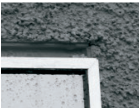
Bei diesem vorstehenden Fenster wurden nicht geeignete Profile ohne Detailplanung nicht fachgerecht eingebaut.

geht die mehr und mehr ausufernde nationale und europäische Normung vom bisherigen Grundsatz ab, Lösungen für immer wiederkehrende Aufgaben unter Berücksichtigung des jeweiligen Standes von Technik und Wissenschaft sowie der wirtschaftlichen Gegebenheiten anzubieten – eine bedenkliche Entwicklung.