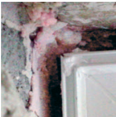
Bildausschnitt aus einem Prüfzeugnis. Im Eckbereich wurden die Profilstöße einfach mit Dichtstoff zugekleckert.