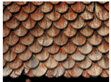
Der Anstrich ist total versprödet, das Holz der Schindeln jedoch in Ordnung.