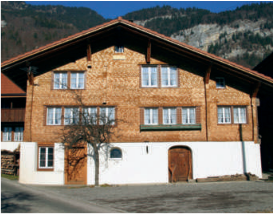
Schindeln unterschiedlicher Eigenfarbe wurden hier benutzt, um Ornamente zu gestalten.

Ein weiterer Grund für Schäden an beschichteten Schindelfassaden ist die ungenügende Wasserdampfdurchlässigkeit der Beschichtungsstoffe, die bekanntlich nur einseitig auf die Schindeln aufgetragen werden können. Wasser kann also seitlich in den Schindelschirm eindringen und bei Sonnenbestrahlung durch den entstehenden Wasserdampfdruck die Beschichtung abheben.