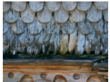
Der untere Teil dieses Schindelschirms ist durch Fäulnis zerstört.