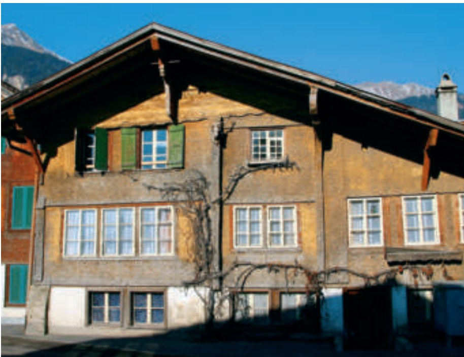
Die grauen Partien waren dem Regen ausgesetzt, die dunkelbraunen nicht.

Ein weiterer Grund für Schäden an beschichteten Schindelfassaden ist die ungenügende Wasserdampfdurchlässigkeit der Beschichtungsstoffe, die bekanntlich nur einseitig auf die Schindeln aufgetragen werden können. Wasser kann also seitlich in den Schindelschirm eindringen und bei Sonnenbestrahlung durch den entstehenden Wasserdampfdruck die Beschichtung abheben.