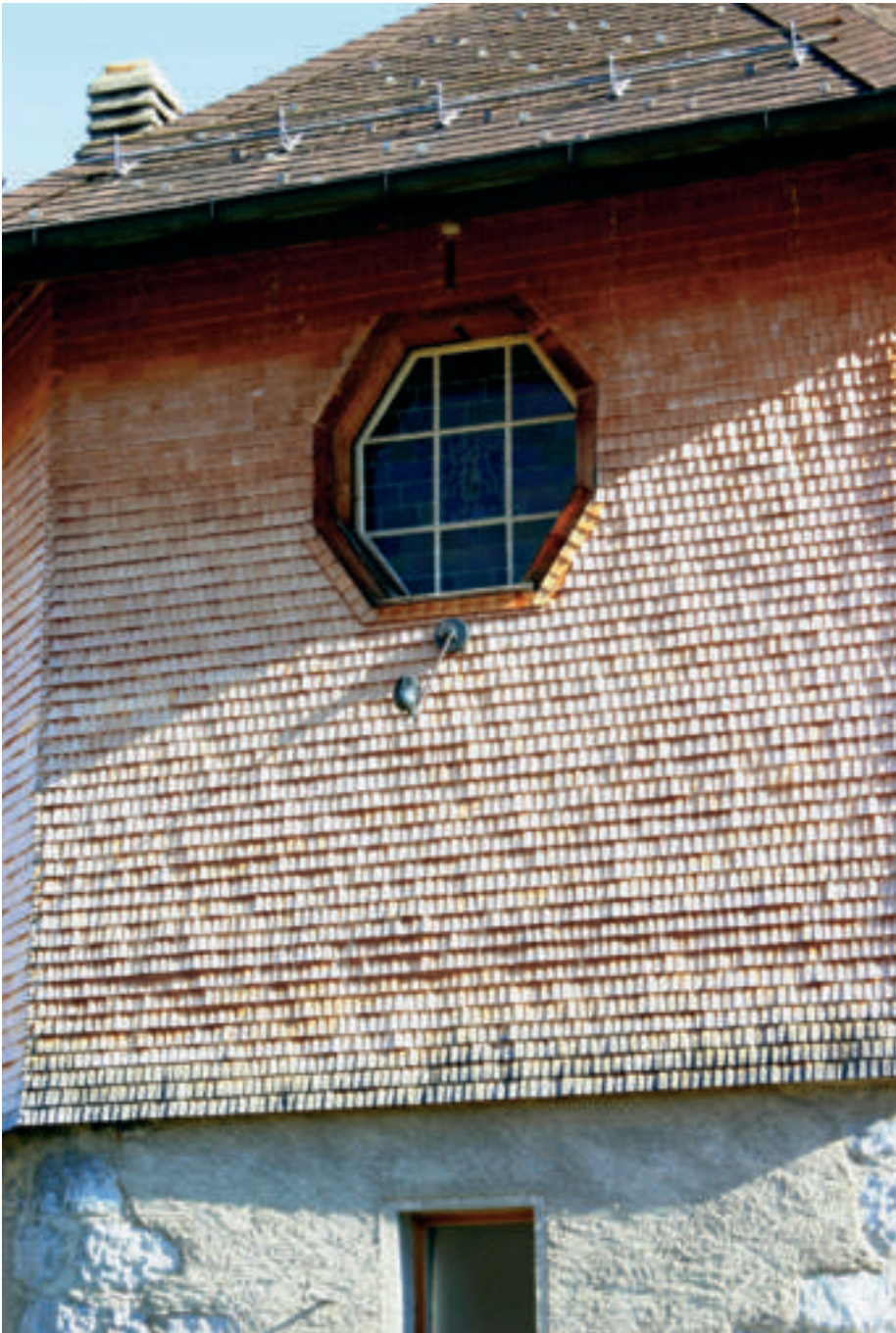
Der dem Wetter ausgesetzte Teil der Fassade ist ausgebleicht und zeigt im unteren Teil beginnende Bläue. Der obere, wettergeschützte Teil ist nachgedunkelt.

Im Gegensatz hierzu stehen die Partien der Fassade, die dem Regen ausgesetzt sind. Hier tritt ebenfalls primär eine Dunkelfärbung des Holzes ein. Mit dem Nachdunkeln des Holzes wird das Lignin jedoch wasserlöslich und somit aus der Fassade ausgewaschen. Das Holz wird, da nun die Zellulose überwiegt, weiss. Die freiliegende Zellulose ist stark hygroskopisch und anfällig auf den Befall mit Pilzen, die Wetterseite der Fassade nimmt dadurch einen silbergrauen bis dunkelgrauen Farbton an. Spätestens jetzt will