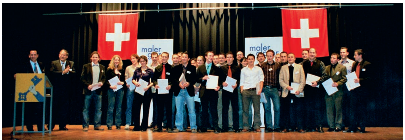
Insgesamt 29 Kandidaten (4 Frauen und 25 Männer) haben die Malermeisterprüfung 2006 bestanden.