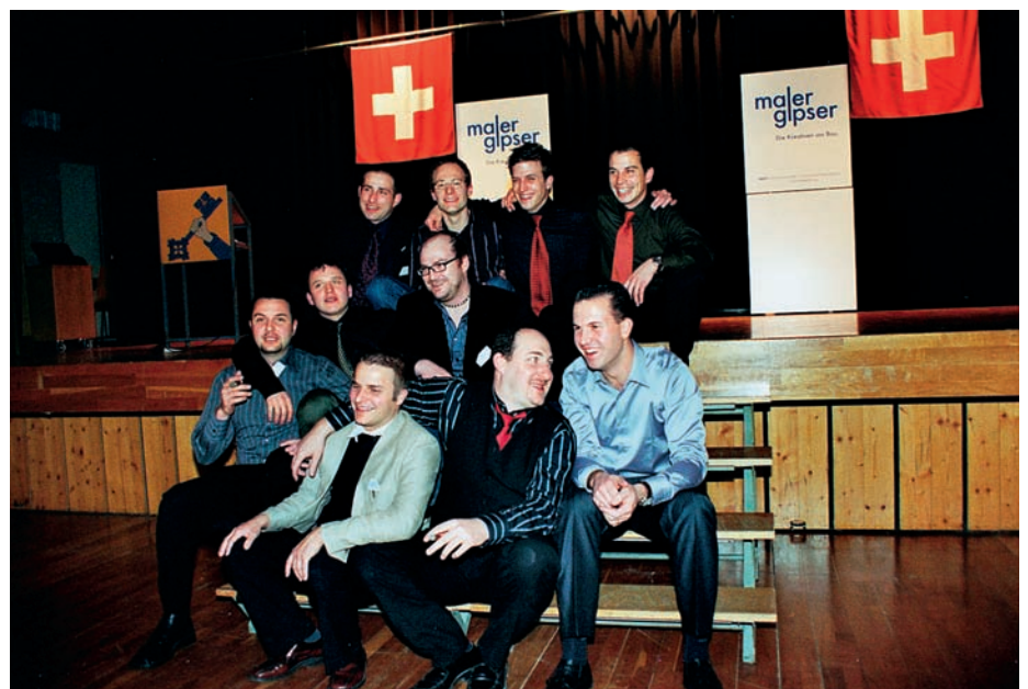
Mit ausgelassener Freude feiern die jungen Meister ihr Diplom.