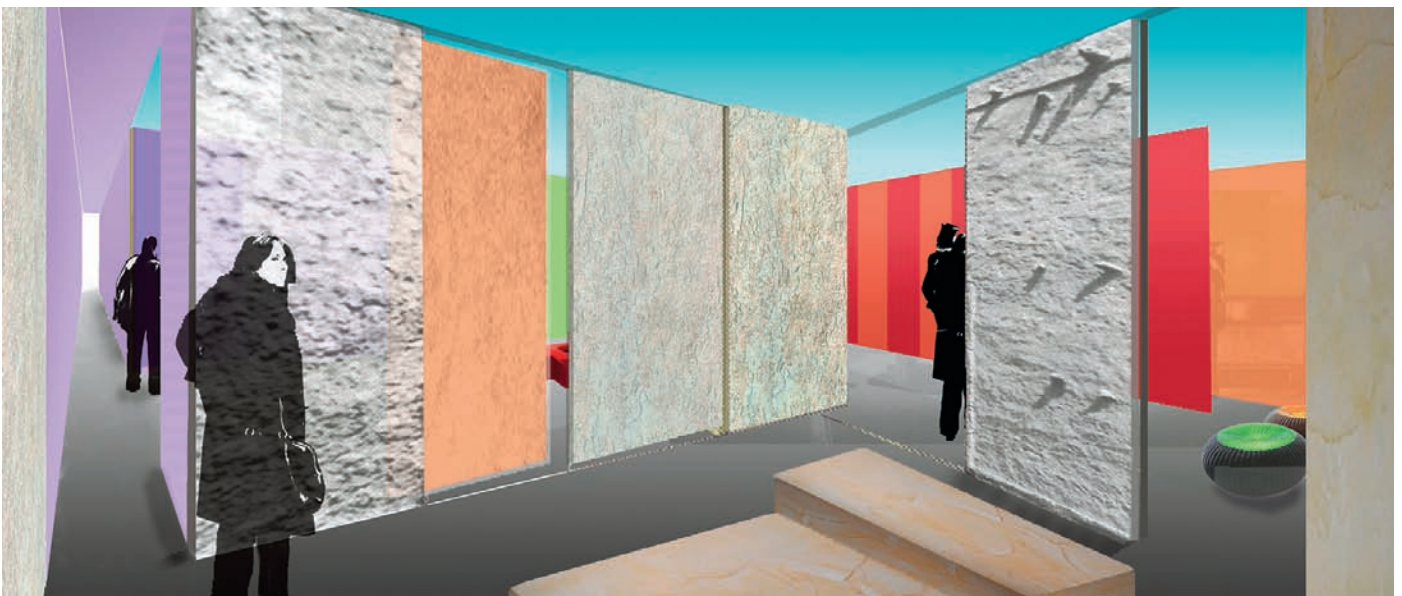
2 ... aus der durch Verschieben von Wandelementen der Übergang in die benachbarte Energiezone frei wird.