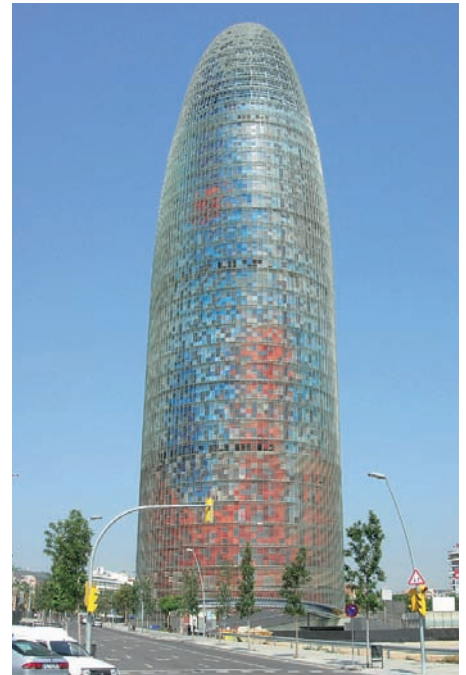
Als Inspiration für die Gebäudeform des Torre Agbar gibt der Architekt Jean Nouvel die fingerförmigen Felsen des Montserrat, des schroffen, katalanischen Wahrzeichens, an.

sind und den äusseren Betonring perforieren. Darüber gestülpt ist eine Glashaut aus tausenden Lamellen, die das Bauwerk je nach Lichteinfall mit Reflexen und Farbverläufen überziehen. Der Turm ist Nouvels erster Wolkenkratzer und Hauptsitz des Konzerns Aguas de Barcelona – der Wasserwerke von Barcelona. In die Planung dieses Gebäudes hat Nouvel auch Überlegungen des verstorbenen Architekten Antoni Gaudí einbezogen. Der Turm stellt eine Huldigung an Gaudí dar.