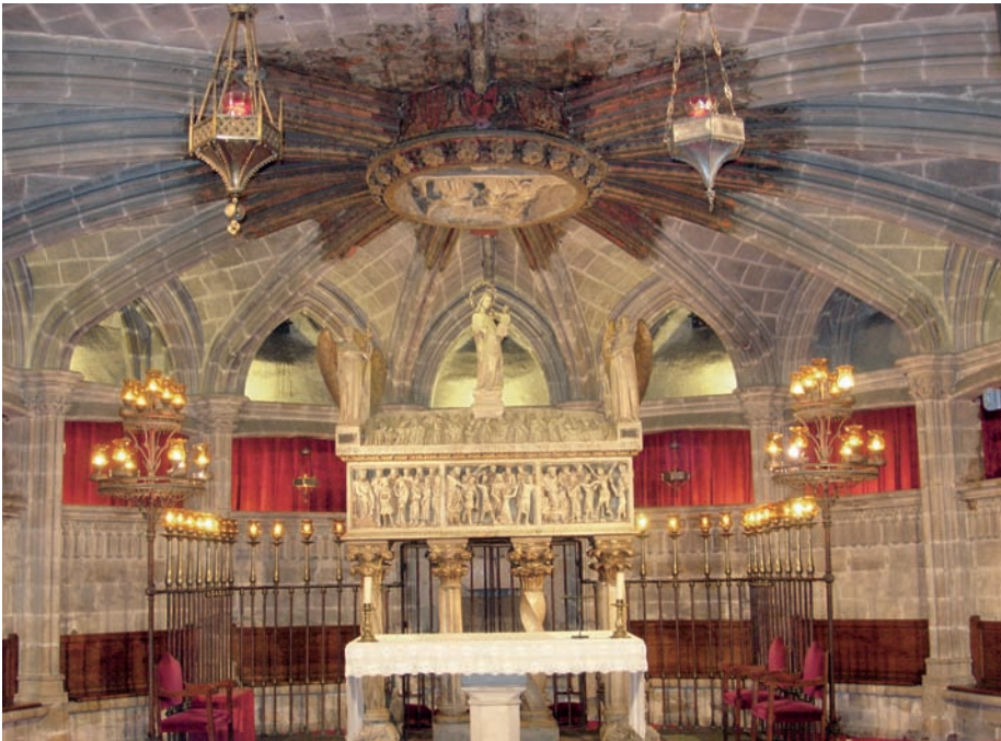
Die Kathedrale La Seu steht an einem grossen Platz inmitten des engen Barrio Gótico. Den Beinamen La Seu, Sitz, verdankt sie ihrer Funktion als Bischofssitz.