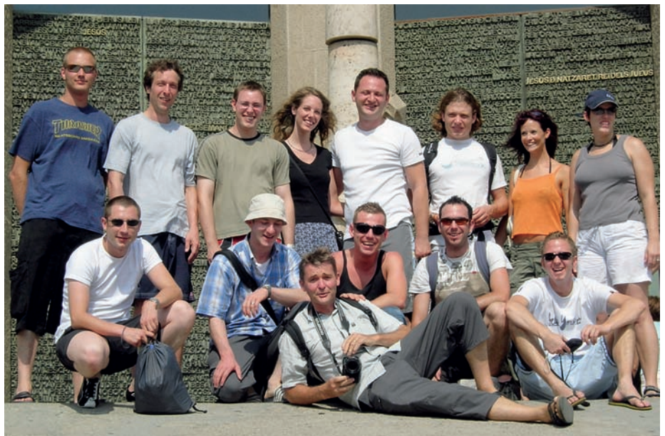
Die Malermeisterklasse 2004–2006 aus der Gewerblich-Industriellen Berufsschule Bern in der katalanischen Hafenstadt Barcelona.