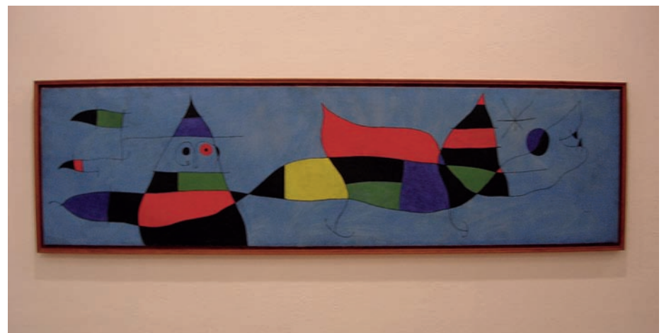
Joan Miró ist für seine verspielte Kunst bekannt. Auf den ersten Blick wirken seine Bilder naiv und beinahe kindlich. Ganz im Gegensatz zu seiner Kunst war Miró ein grundsolider, hart arbeitender Mann, der am liebsten in dunklen Geschäftszügen herumlief.

Doch nun zu Picasso: Pablo Ruiz y Picasso wurde am 25. Oktober 1881 in Málaga als erstes Kind des Malers und Zeichenlehrers José Ruiz Blasco und seiner Frau María Picasso López geboren. Schon im Alter von acht Jahren malte Picasso auf Anregung seines Va-