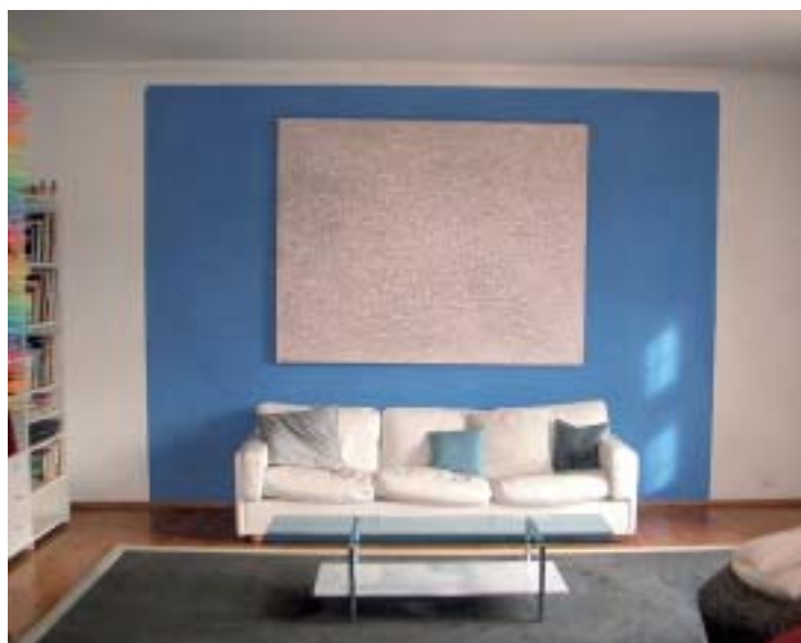
Durch einen Farbakzent erhalten der Ort des Geschehens – und somit auch die Menschen, die sich dort aufhalten – volle Aufmerksamkeit. Der Raum bleibt in seiner Form stabil, und der Bunnton kann kräftig gestrichen werden (links: vorher; rechts: nachher).