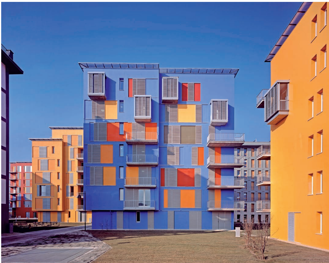
2 Die unterschiedlich dimensionierten Plätze, Höfe und Nischen werden durch die kräftigen Farben zu wohnlichen Innenräumen.

erzählt Erich Wiesner. «Das finde ich total stark. Das war für mich eine schöne Möglichkeit, gleichwertig mit den Räumen und den Häusern umzugehen.»