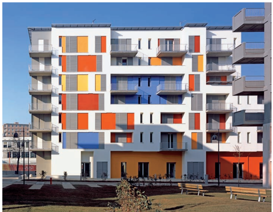
6 Durch die farblich kräftig betonten Einschnitte im Fassadenprofil erinnert dieser Baukörper stark an Berliner Bauten von Bruno Taut.