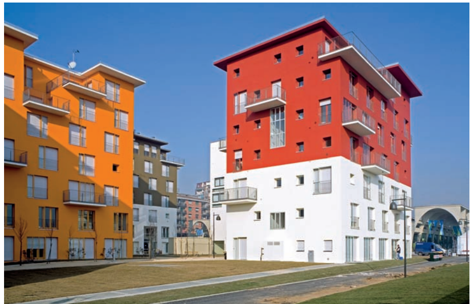
5 Ein stark buntes Volumen auf einem umlaufenden weissen Sockel lässt die Häuser instabil wirken.

Die entstehenden Bilder faszinieren, der Wechsel der Farben ist spannend. Die Farbe fließt. Nach der Nutzung durch die olympischen Spieler im Februar 2006 ist das Viertel wieder menschenleer. Die Bauten wurden erst im Oktober 2006 abgenommen. Ein einzelner Besucher verliert sich leicht in dem Farbenmeer, in welchem ein neutral gefärbtes Volumen wie ein Felsen wirkt, etwa das Gebäude mit dem hohen Natursteinsockel. Die Dunkelheit und die künstliche Beleuchtung weichen die knalligen Farben auf, und es entsteht der Eindruck einer gewachsenen südländischen Stadt. →