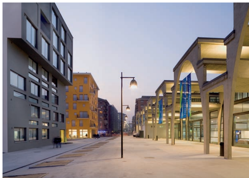
3 Farblich und baulich ist der skulpturale Turm (Bild links) der Architekten Diener und Diener ein Brückenkopf zur angrenzenden beton-grauen Markthalle (Bild rechts).

in einem etwas dunkleren Ton (Bild 4). Im Innern des zweiten Feldes spielt diese Farbe ebenfalls eine bestimmende Rolle. Sie reflektiert die Sonne und taucht so die angrenzenden Höfe in ein warmes Licht, das bis in die umliegenden Wohnungen strahlt. So weich Wiesners Farben sind, so scharf verfährt er mit den Baukörpern.