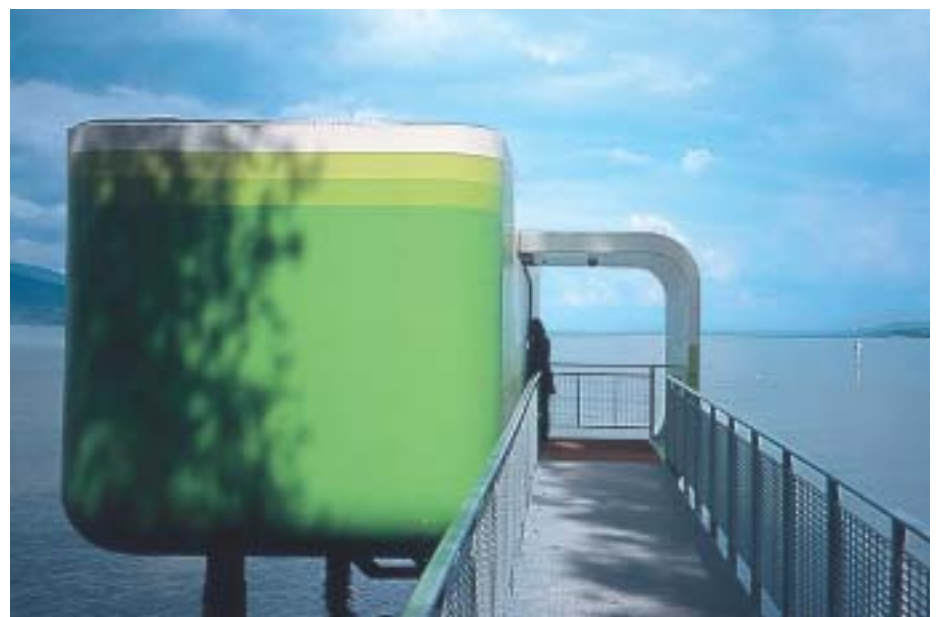
Living in a box: Fiberglas in Limettengrün wirkt erfrischend anders.

Wenn wir Farbgestalter Oberflächen entwickeln oder für bestimmte Anwendungsbereiche in der Architektur verwenden, gilt es, zwei Gestaltungsdimensionen zueinander in Beziehung