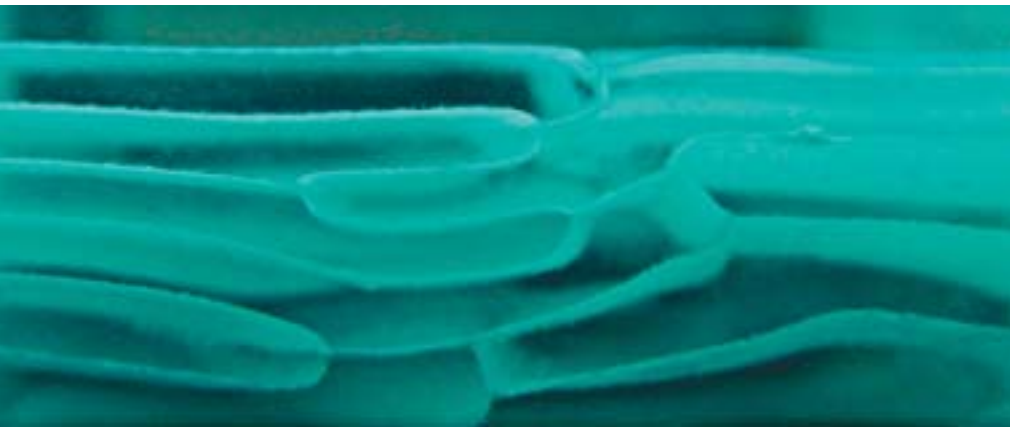
Organische Glasschichten in Glaspaneelen erinnern an gewachsene Landschaften.