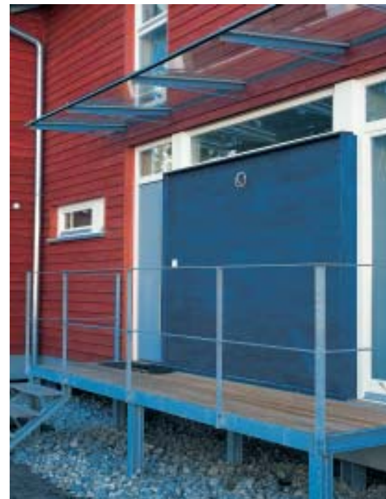
Struktur und Rhythmus werden vom Material erzeugt.

sind auf ein Mindestmass zurückgebildet, und beim privaten Hausbau spielen variantenreiche Farb- und Oberflächenstrukturen kaum noch eine Rolle. Das Neonweiss an der Fassade zeigt sich im Innern analog als verkümmertes Raufaser-Weiss.