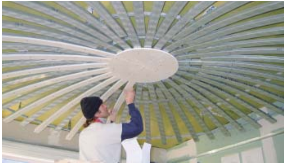
Die Vorfertigung von Einzelteilen im Werk spart auf der Baustelle Zeit und Geld. Hier wird eine vorgefertigte Kuppel aus Einzelteilen zusammengesetzt.

noch ist die Wand ausserordentlich stabil und auch für das Anbringen von grossen Einzellasten bestens geeignet.