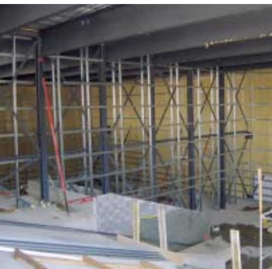
Im Kino Europlex in Lausanne wurden in sieben Kinosälen in Trockenbauweise Wände in einer Höhe bis zu 11 m erstellt.

mung stellen sie derzeit die Grenze des technisch Machbaren dar. Hier übertreffen Gipsplattenkonstruktionen sogar Stahlbetonwände gleicher Dicke.