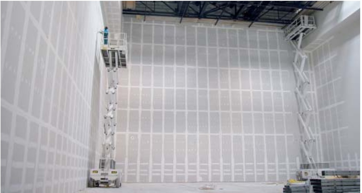
Bei diesem Lagerhaus in Marseille wurden in Trockenbauweise 20 m hohe Wände errichtet, die oben noch eine Auskrugung von 2 m aufweisen.

nicht umgekehrt. Diese Tatsache führt zwangsläufig zu Bauweisen, die ein Höchstmass an Flexibilität erlauben, d.h. veränderbar sind und den unterschiedlichen Bedürfnissen der Wohnungsnutzer angepasst werden können. Ist dies nicht der Fall, so kann es zu leer stehenden Wohnungen und damit verbunden zu fehlender Rendite der Objekte kommen.