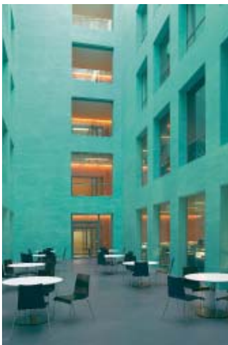
Der Lichthof repräsentiert das Element Wasser und ermöglicht durch die Fenster den Blick auf das Treppenhaus, das dem Element Feuer zugeordnet ist.