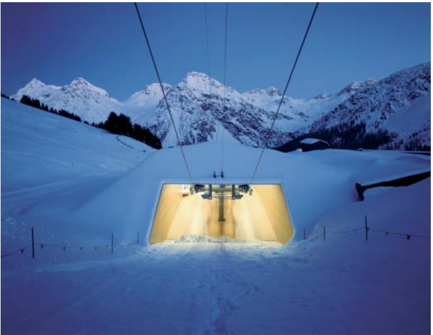
6 Die Talstation der Sesselbahn Carmenna in Arosa führt die Skifahrer von der Gemächlichkeit des Schlangestehens über in die zügige Bergfahrt. (Verfasser: Bearth + Deplazes Architekten AG; Mitarbeiter: Patrick Seiler; Bauherrschaft: Arosa Bergbahnen AG)