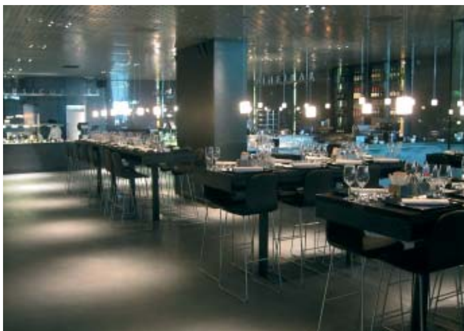
3 Die Wahl von Material und Farbe beeinflusst und unterstützt die unterschiedliche Zeitwahrnehmung an verschiedenen Orten in einem Warenhaus. (Globus am Bellevue in Zürich, Brunner Eisenhut Architekten und Beat Soller)

Ein eindrückliches Beispiel ist die von Henri Labrouste 1858–1868 er-