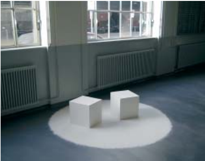
4 Was unvergänglich wie Steinblöcke aussieht, ...