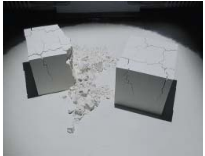
5 ... sind in Wahrheit aus Mehl geformte Würfel, die schon nach wenigen Tagen zerbröckeln. (Agatha Zobrist und Theres Wäckerlin, Rauminstallation, 1999, Werkstatt der Swissmill Zürich; Fotos: Agatha Zobrist)