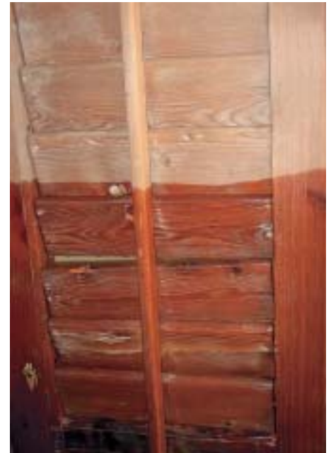
Farblose Holzschutzimprägnierung auf Leinölbasis.

Tauchgrundierung in einem EMPA-geprüften, siebenminütigen Trommelverfahren appliziert.