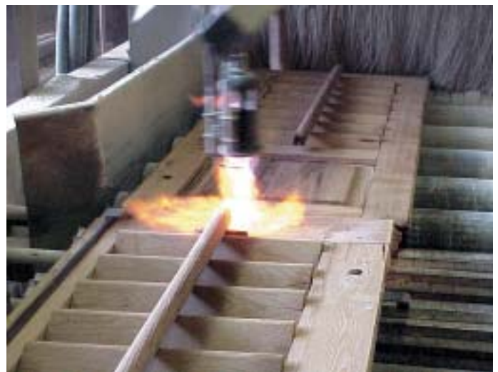
Durch Abflammen und anschließendes Strahlen lassen sich aufstehende Holzfasern entfernen.