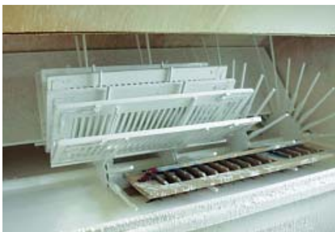
Tauchgrundierung von Holzfensterläden im Trommelverfahren.

Der Decklack – hochglänzend oder seidenglänzend – muss hohen Anforderungen genügen. Neben einem perfekten Finish erwartet der Kunde vor allem, dass der Glanz viele Jahre erhalten bleibt. Festkörperreiche, langölige, lösemittelarme Kunstharzlacke auf Silikonalkydharz-basis zeigen hier ausserordentlich gute Eigenschaften.