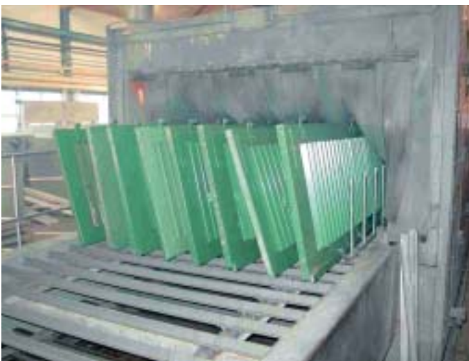
Automatisches Ablaugen von Holzläden in einem 5-Zonen-Ablaugeautomaten.

Tauchgrundiert wird immer in zwei Schritten. Zunächst erfolgt eine farblose Tiefenimprägnierung auf der Basis von Leinöl. Dann wird eine weisse