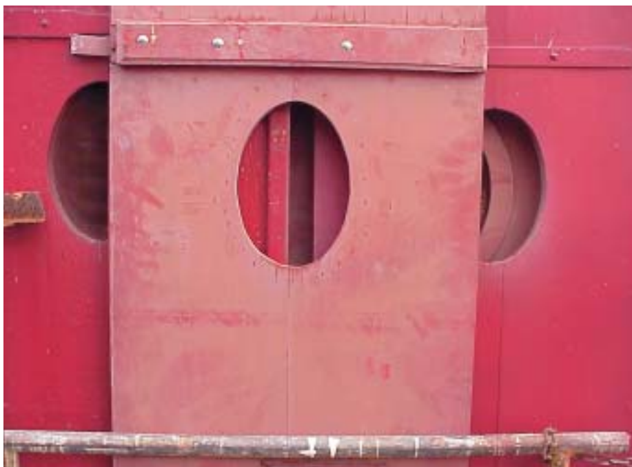
Während Jahren der Witterung ausgesetzt, kann die Oberfläche von Fensterläden kreiden, doch die Substanz ist noch gut.

keit ausgelegt. Die Dauerhaftigkeit beginnt mit qualitativ gutem Holz und der richtigen Konstruktion. In der Schweiz wird für Holzläden meist Fichte, Tanne oder Lärche gewählt. Ärgster Feind des Holzfensterladens ist Wasser. Deshalb werden möglichst alle Aussenkanten und Ecken gerundet, damit sich auch dort eine genügende Schichtdicke der Anstrichstoffe ergibt.