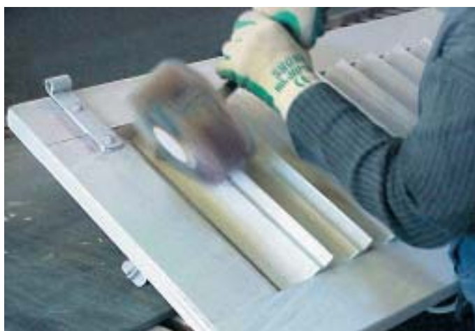
Das Feinschleifen von Hand liefert die Grundlage für eine lange Haltbarkeit des Farbanstrichs.