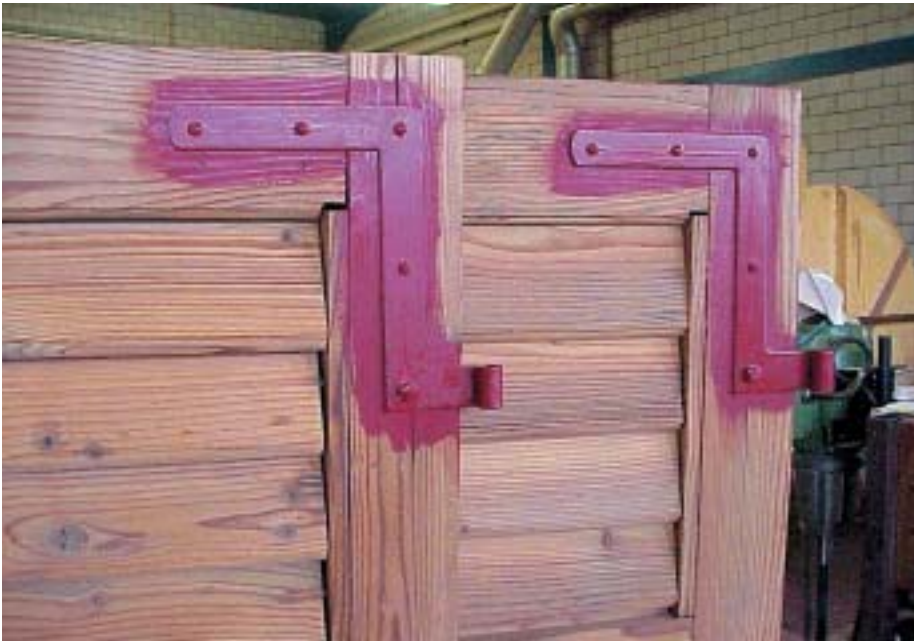
Beschläge sind separat zu grundieren.