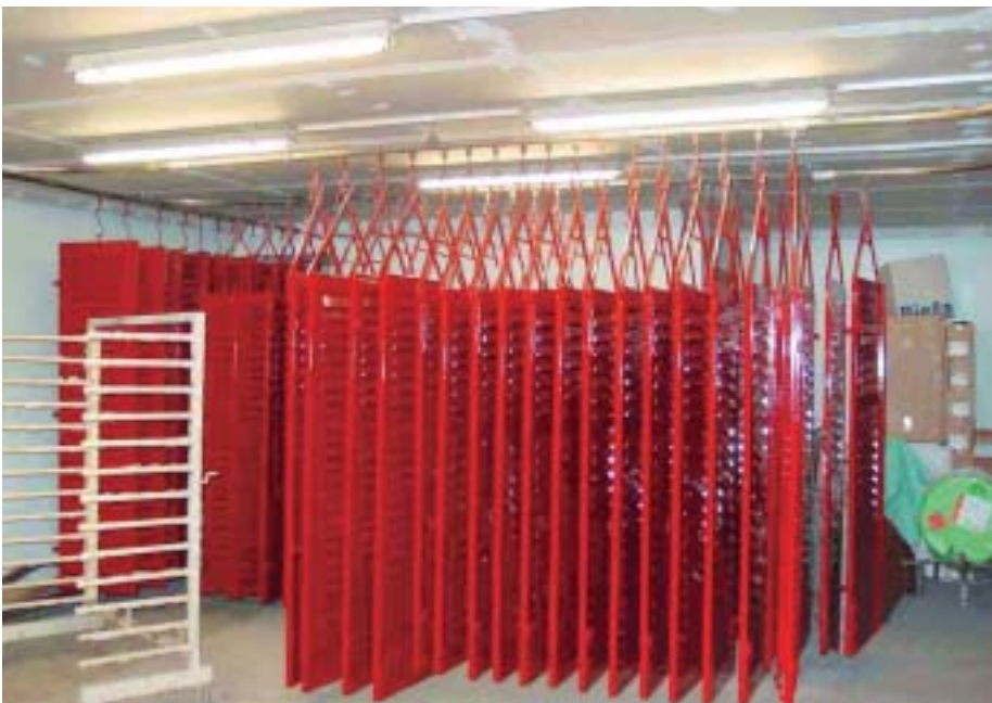
Fertig lackierte Holzfensterläden im Trockenraum.