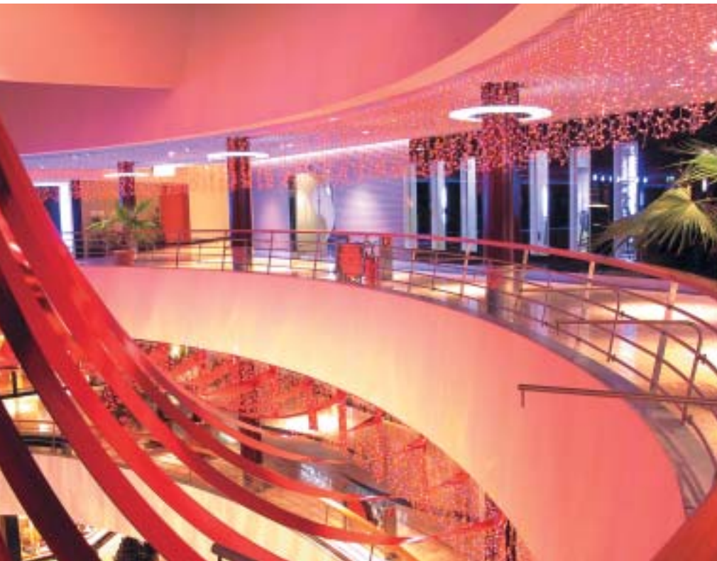
Silber Trophy: Einkaufs- und Freizeitzentrum La Praille, Carouge