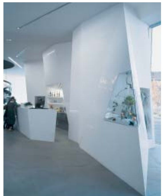
Gold Trophy: Aargauer Kunsthaus, Aarau