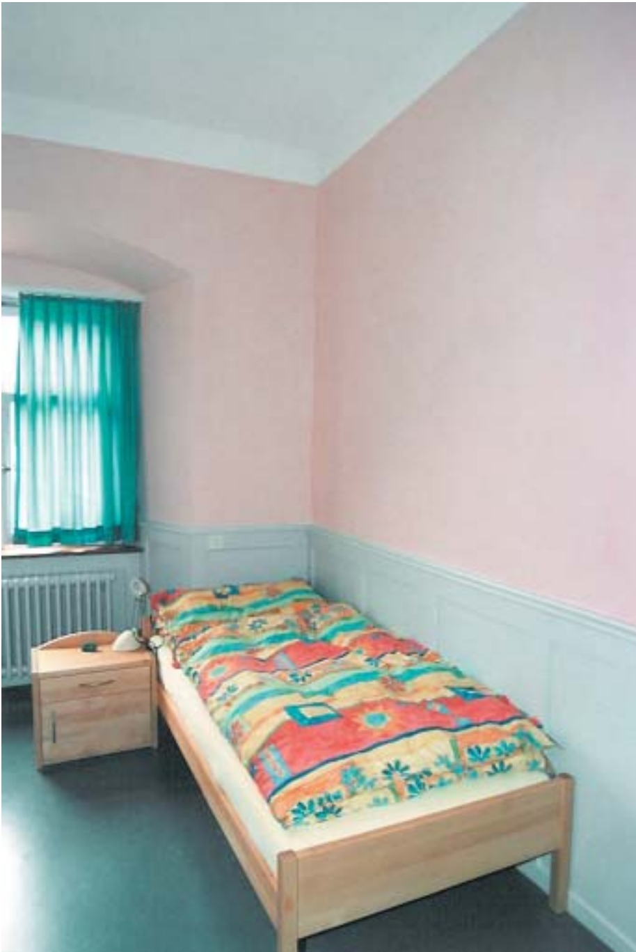
Rosa. Eines von drei Musterzimmern für eine psychiatrische Klinik (neben Hellgelb und Hellblau). Das roséfarbene Zimmer vermittelt Geborgenheit. Der petrolfarbige Linoleum bringt Kühle, Ruhe und einen farbigen Kontrast in das Zimmer. Die Bettwäsche wurde vom Patienten aus drei Motiven, die zur Auswahl standen, selbst gewählt