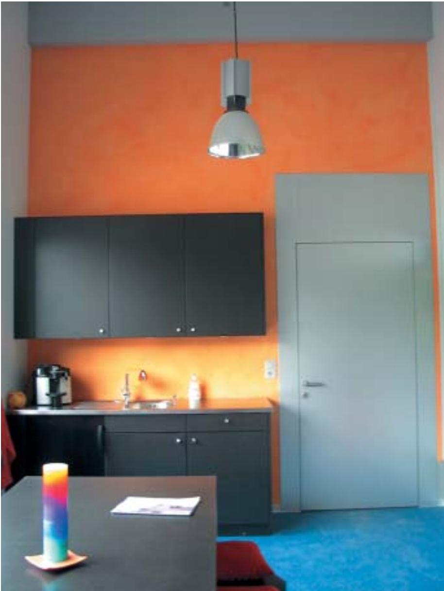
Orange. Mitarbeiterraum. Hier geht es sowohl ums Essen als auch um soziale Kontakte unter den Mitarbeitern. Gestalterisch gesehen, bildet die orange Wand einen warmen Ausgleich zum blauen Linoleum-Boden und zur dunkelgrauen MDF-Küche

uns, die Eindrücke auf unserem Weg durch das Leben zu verarbeiten (verdauen), sprich das aufzunehmen, was uns gut tut und das loszulassen, was uns belastet. Um etwas loszulassen, muss ich meine Hand aber öffnen. Orange steht für das öffnende Prinzip und hilft, sich dem Leben zu öffnen und den Weg zu gehen – mit der Kraft von Rot und der Beweglichkeit von Gelb.