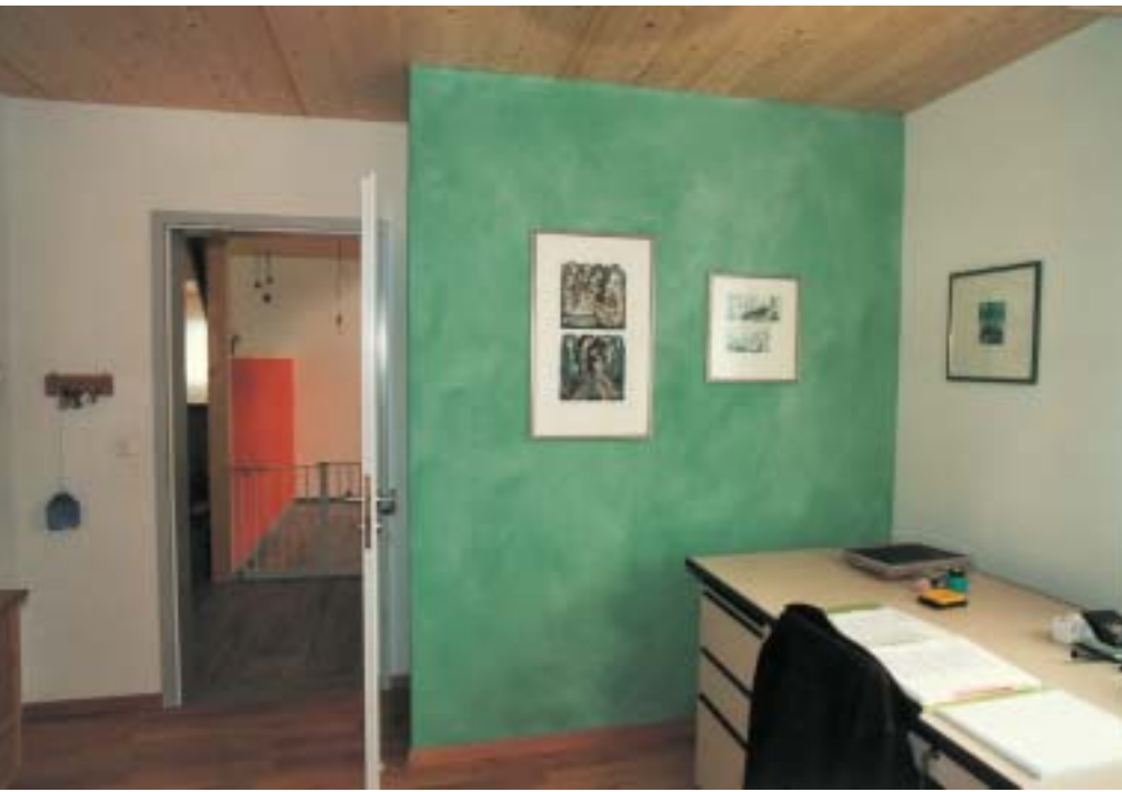
Grün. Büro mit grün lasierter Wand. Im Hintergrund die farbige Treppenhauswand als Gegenspieler. Grün ist übrigens ein angenehmer Ton zu rötlichen Holzböden