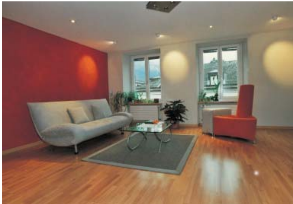
Rot. Wohnzimmer, privat. Die rote Wand wurde auf den neuen Stuhl abgestimmt und bringt die graue Couch zur Geltung. Der Stuhl erhält durch die Unterstützung der Wand noch mehr Gewicht und wird in die Raumgestaltung eingebunden

Rot ist in den meisten Sprachen die erste Farbe, die einen Namen erhält. Rot ist die «Urfarbe» – die Basis. Rot ist auch dem Basis-Chakra zugeordnet und hilft «verwurzeln». Rot gibt Standfestigkeit und Urvertrauen. Rot ist das Blut, deshalb hat Rot auch eine existenzielle Bedeutung. Dadurch, dass wir Rot mit Blut verbinden, steht es für Gefahr, Auf-