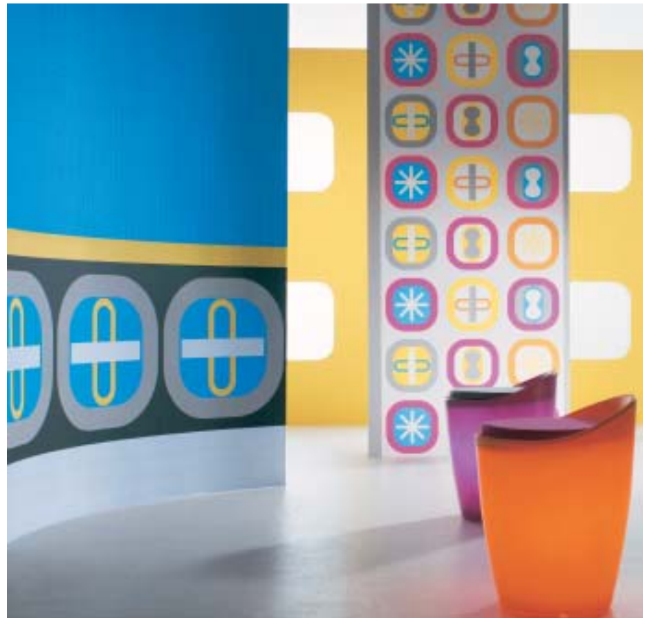
Marburg: Art Borders. Die Formensprache von Karim Rashid bewegt sich zwischen organischen Piktogrammen und Pixeloptik und Op-Art Reminiszenzen

Omexco: Silver & Gold. «Diese gelungene Kollektion präsentiert sich so kostbar, wie es ihr Name verheisst. Der Glanz von Silber, Gold und Bronze dieses Vliesmaterials erscheint einmal als metallischer Staub bei den Unis und kleinen Mustern, dann wieder als kraftvoller Belag mit kontrastvollem Farbumfeld. Zeitloses Design mit einem kurzen Blick in die 60er und 70er Jahre.»