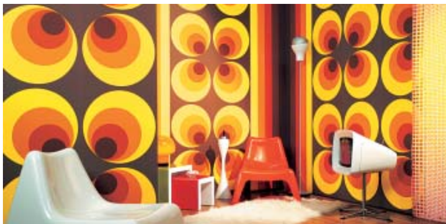
AS Creation: Retro Vision. Neue Kollektion im Stil der 70er Jahre

Omexco: Onyx. «Schöne Vlieskollektion mit warmen Metallicfarben.»