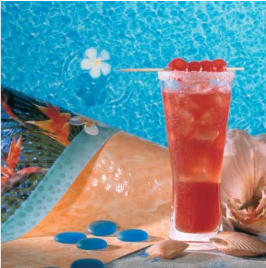
Marburg: on the beach. Lust am gekonnten Stilbruch. Lebensfreude. Humor

stylgruppe entstehe aus Gegenpolen, die sich anziehen. Durch ein «Salto mortale» werde ein neues Ergebnis geschaffen. Das heisst, aus dem Gegensätzlichen wird Harmonie. Laut Frank sollte man nie direkt «aus dem Kochbuch kochen». Der neue Trend entstehe erst durch Anti-Technik: «Die Ruhe muss in Unruhe, um den Kontrasteffekt zu erhalten.»