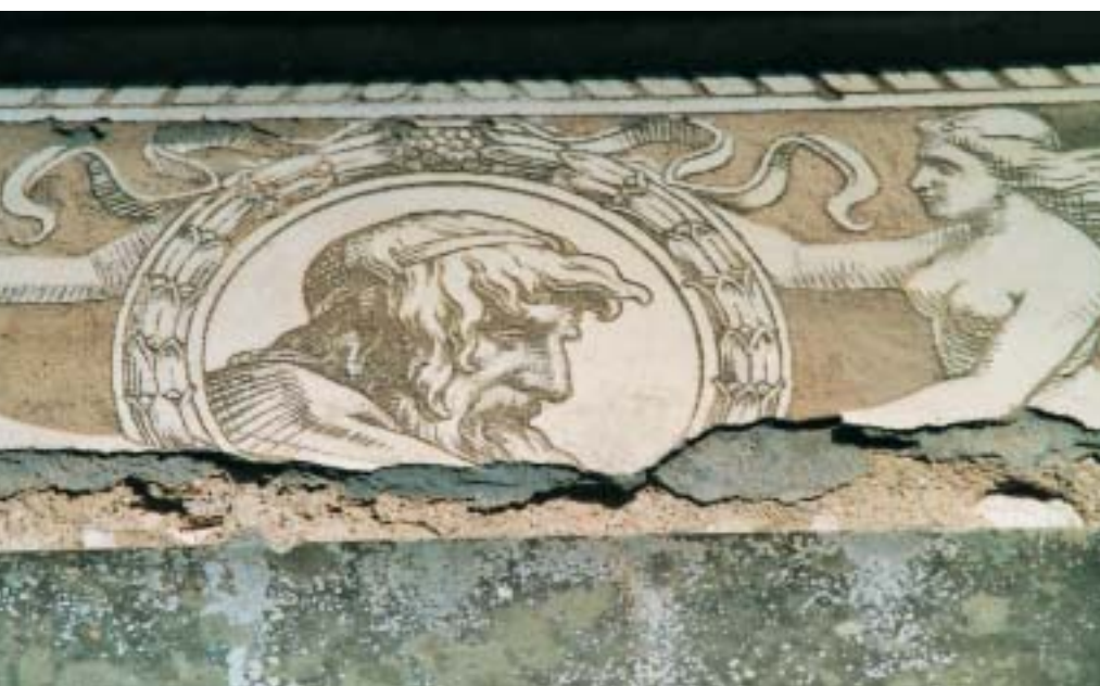
Bildausschnitt in Schadenzone über Sandsteingut aus dem Museum Zofingen AG

Die materialtechnisch, ästhetisch und bauphysikalisch dem Objekt adäquaten Materialselektionen und Appli-