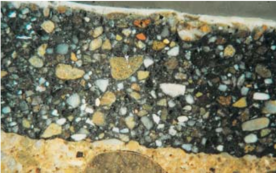
Materialaufbau in 12-facher Vergrößerung, Grundputz, eisenoxideingefärbter Putz, helle Überarbeitung

kationstechniken sind Anforderungen an das Handwerk, die mit Sorgfalt und beruflicher Kompetenz umgesetzt werden sollten.