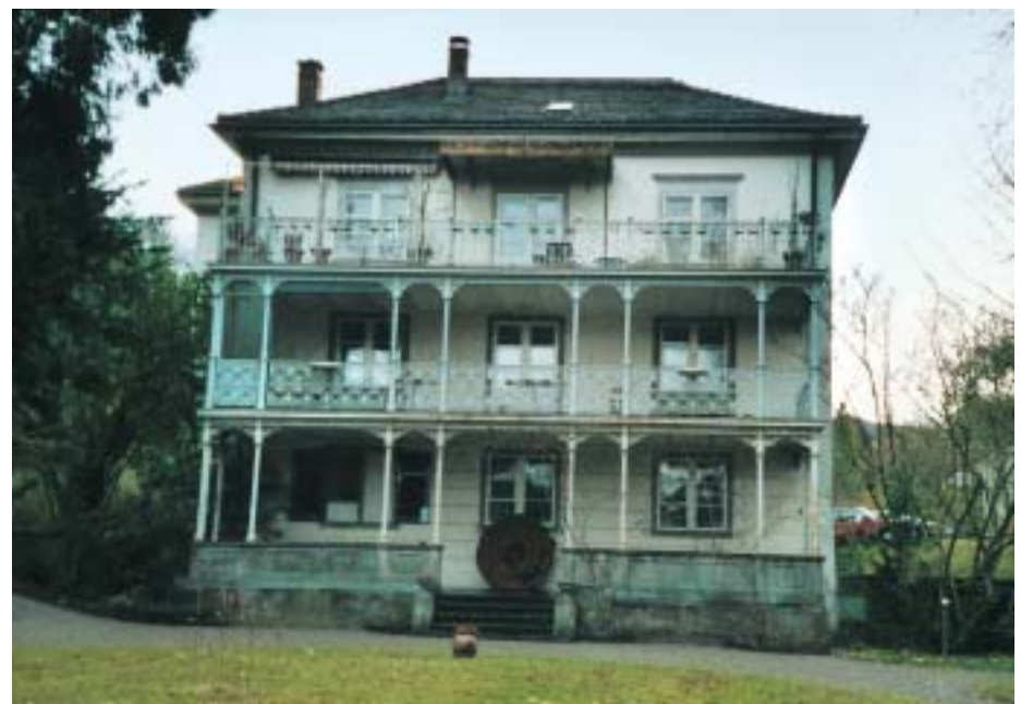
Ansicht der Parkfassade der Villa Biedermann in Winterthur

Warum aber wurde in den letzten 100 Jahren mit gigantischem Aufwand immer weiter geforscht? Im Vordergrund stand und steht immer noch die Qualitätsverbesserung, das heisst die